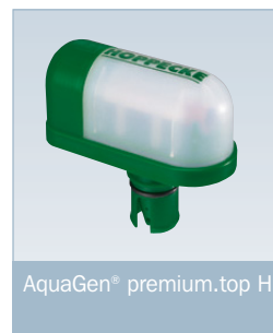
AquaGen® premium.top H

Für Kapazitäten bis 340 Ah sowie für Anwendungen mit abmessungsbedingten Einschränkungen (wie Höhe in Bezug auf die Batterieaufstellung sowie Tiefe in Bezug auf das Zellenmaß) ist die Ausführung AquaGen® premium.top H verfügbar.