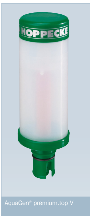
AquaGen® premium.top V

Рекомбинаторы AquaGen® premium.top устанавливаются на аккумуляторные элементы. Таким образом, исключается рост температуры в аккумуляторе. Вынесение процесса рекомбинации за пределы корпуса аккумулятора позволяет максимально повысить безуходность и сделать батареи с жидким электролитом аналогичными герметизированным. При этом не наблюдаются эффекты снижения срока службы и ограничения, связанные с эксплуатацией.