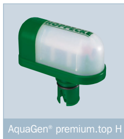
AquaGen® premium.top H

Для аккумуляторов ёмкостью до 340 Ач, а также для применения в ограниченных по габаритам пространствах (например, при ограниченном расстоянии между полками аккумуляторных шкафов) используется горизонтальное исполнение AquaGen® premium.top H.